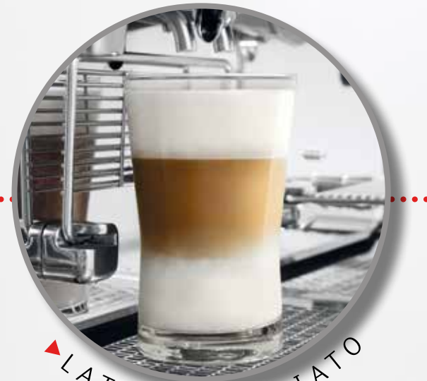
▶ LATTE MACCHIATO